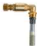
5 Diffusörarmatur inkl. backventil